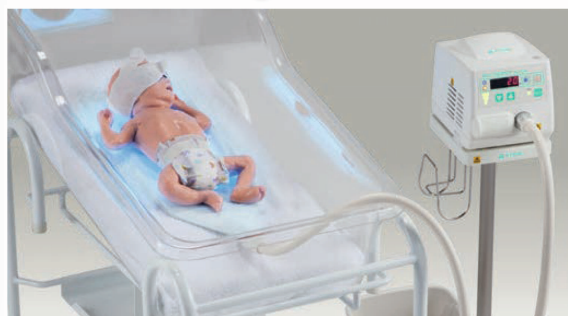
Fototerapia w inkubatorze otwartym lub w łóżeczku