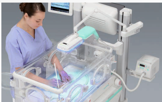
Fototerapia w inkubatorze zamkniętym